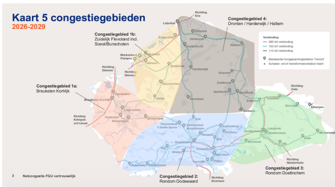
Figuur 2: indeling van FGU in vijf congestiegebieden